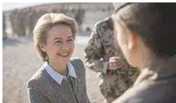
Ursula von der Leyen: contro la spesa pubblica italiana.

https://business.financialpost.com/pmn/business-pmn/europes-rise-in-temporary-work-contracts-puts-lives-on-hold