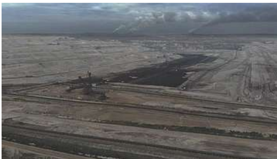
C'era una foresta millenaria, Hambach

Ecco come ha ridotto la sua stessa patria