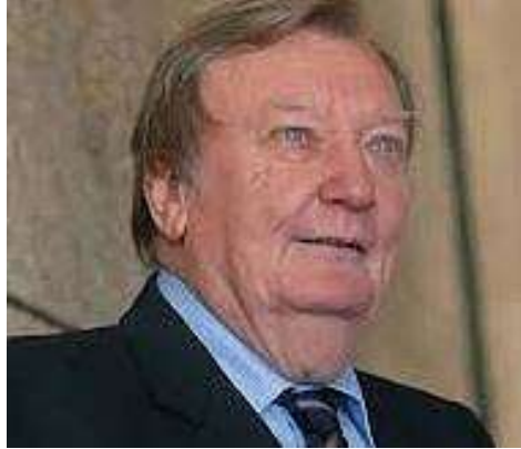
Carlo Rubbia, Nobel per la fisica, smonta la bufala dei cambiamenti climatici