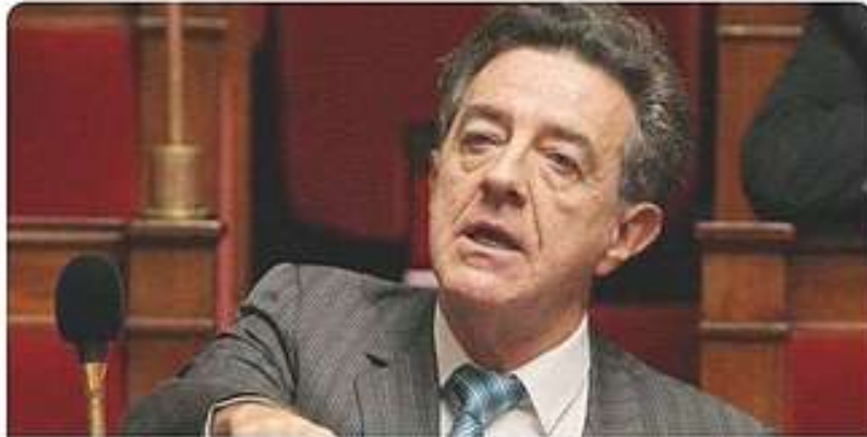
Climat : limiter les naissances «permettrait de mieux accueillir les mi... Yves Cochet, ancien député écologiste et «néo-malthusien» assumé, développe des thèses censées ralentir «l'effondrement de nos sociétés».