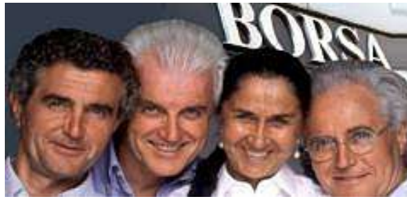
La mappa del potere dei Benetton