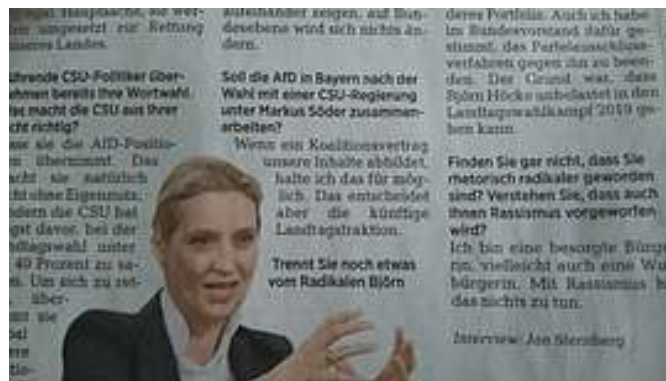
Alice Weidel dell'ÂfD: disposta a governare in Baviera col CSU

I cuori "umanitari" che piangono e strillano sulla disumanità di Salvini, vedranno allora con quale efficienza la Germania procederà alle "espulsioni" dei migranti "secondari". Sarà un'altra presa di coscienza, spero. Come il vostro cronista ha sempre sostenuto a difesa dei tedeschi a proposito dei famosi Lager: non è che sono cattivi. Sono solo efficienti.