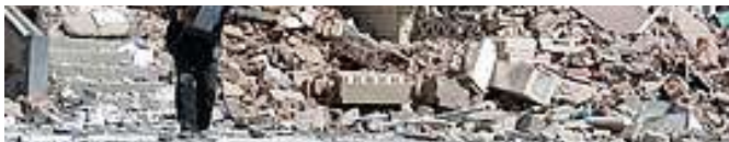
Non sono state le mine italiane, ma i puntatori inglesi al servizio dei sauditi.

a favore dei sauditi nello Yemen è una spinta a favore al-Qaeda nel paese. Al-Qaeda, lì, è in guerra con gli Houthis che hanno preso il controllo di gran parte del paese perché gli Houthis praticano una forma di Islam sciita che sostengono essere legati all'Iran. Stiamo combattendo dalla stessa parte di al-Qaeda nello Yemen.