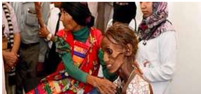
La Marina francese collabora al blocco navale che causa la morte per fame

I militari del Regno Unito "lavorano a fianco" dei puntatori sauditi nella guerra in Yemen Il ministro degli Esteri saudita conferma che i consiglieri militari britannici sono nella sala operativa della campagna di bombardamenti.