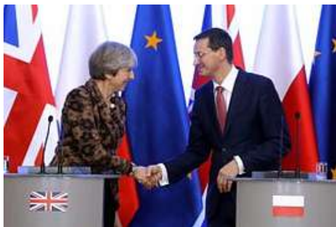
Il nuovo primo ministro polacco Mateusz Morawiecki e il

In Austria , il nuovo governo si propone un taglio massiccio dei benefici ai richiedenti asilo, particolarmente dando solo più benefici in natura (oggi ricevono prestazioni in denaro, 840 euro mese) e nessun alloggio individuale, identificazione accurata di coloro che non hanno dato una chiara identità, attraverso "la lettura o il ripristino dei dati del telefono cellulare e altri mezzi di comunicazione come i social media, per ricostruire l'itinerario" del sedicente richiedente asilo. E rimpatrio rigoroso per quelli che non vengono da paesi in guerra. Se l'Austria si unisce al