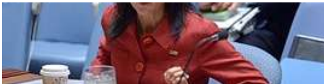
Nikki Haley: “Mi segno i nomi!”

Superpotenza non fa più paura al resto del mondo, e i suoi ruggiti sono quelli della tigre di carta. Una Casa Bianca ragionevole dovrebbe sostituire al più presto la fanatica incapace dannosa per la nazione. Invece Trump ha sostenuto la Nikki rincarando la minaccia: “Questi ci prendono centinaia di milioni di dollari, anche miliardi, e poi ci votano contro. Che votino contro di noi, e noi risparmieremo un sacco. Che ci frega”.