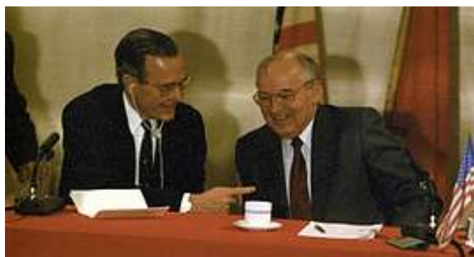
Bush assicurò Gorby: ma non per iscritto. ....

Questo è specificamente diritto internazionale talmudico: doppiezza, inganno, malafede, disprezzo degli esseri inferiori, violazione della parola data – data a chi? Ad animali parlanti?